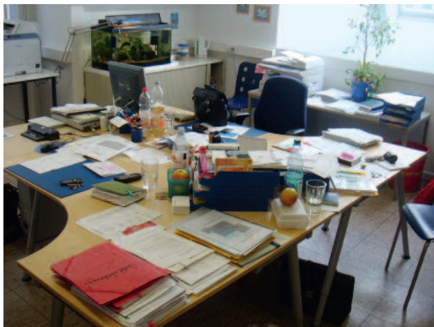
Aus einem unübersichtlichen Schreibtisch ...

Statt also zu lernen, wie sich die Tage akribisch planen lassen, ist schon viel er-