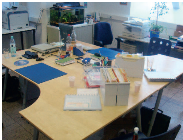
... wird ein ordentlicher Arbeitsplatz.